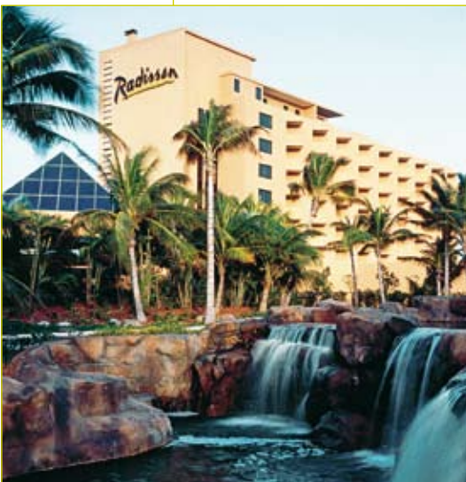
Radisson Aruba Resort

Een verblijfshotel is een hotel dat alle faciliteiten van een gewoon hotel biedt, met daarbovenop activiteiten van recreatieve aard. Vaak zijn ze gelegen in berggebieden, natuurparken of kustgebieden waar de gast van zijn vakantie kan genieten.